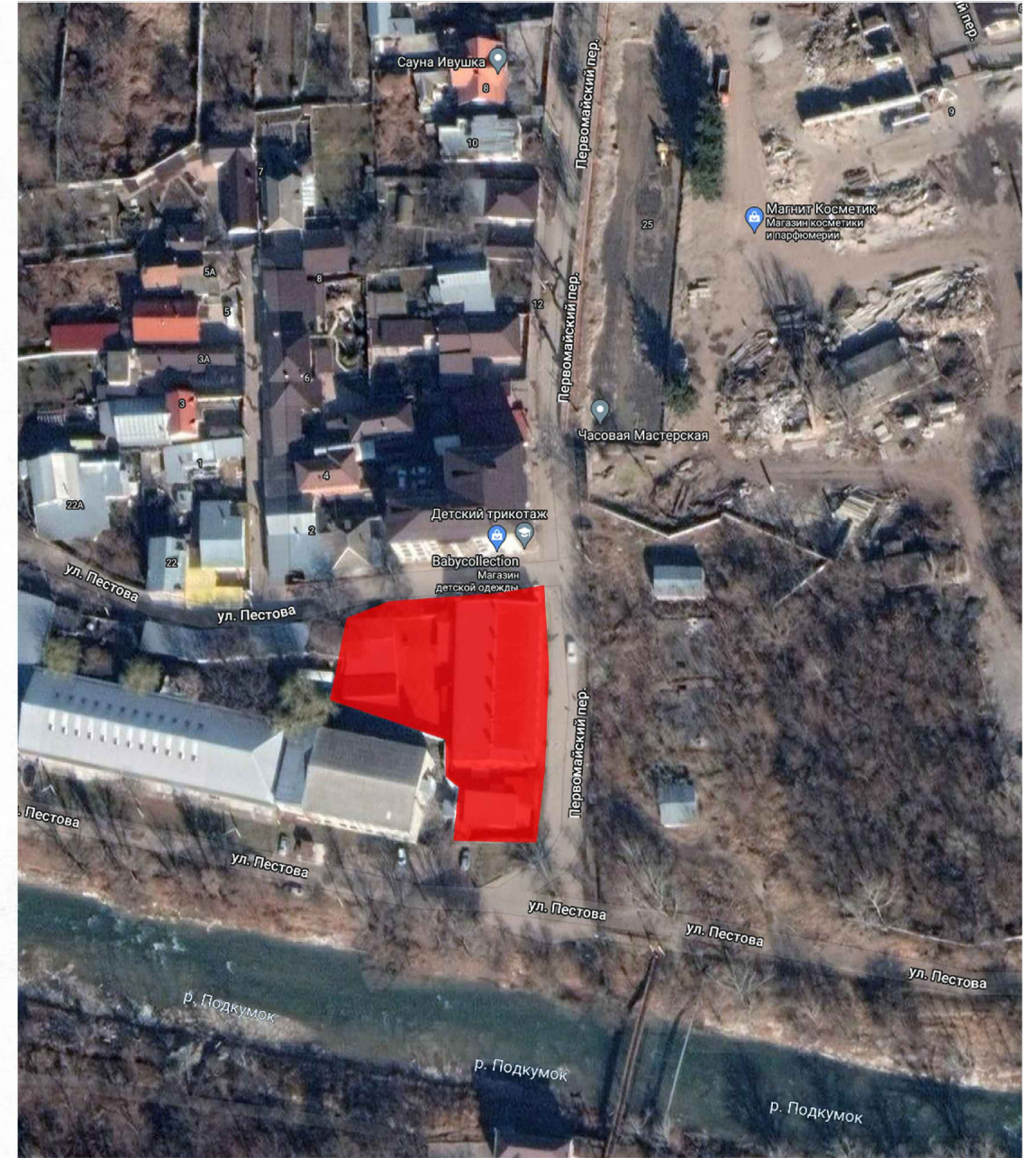
Фасад со стороны ул. Первомайская